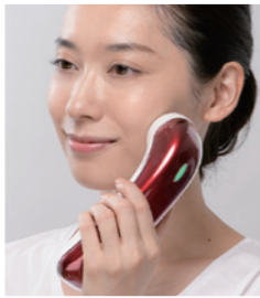
1秒間に3万回の電気振動

高周波美顔器 ¥30,000 (税抜) (VCラニー、ドロウワーラニー、ショッピングバック付き)