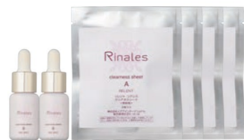
クリアネスシートA 4袋(8回分)防腐剤フリー クリアネスシートB 10mL×2本