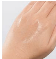
肌になじんだ様子